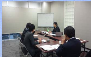
【経営相談会の様子】

専門家による経営相談会実施先数 49 先 各種専門家派遣実施先数 19 先 延91回