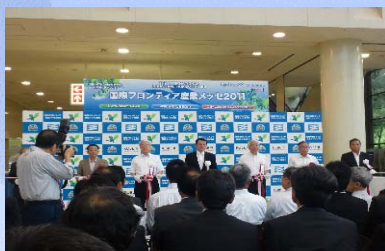
【国際フロンティア産業メッセ2011開会式の様子】