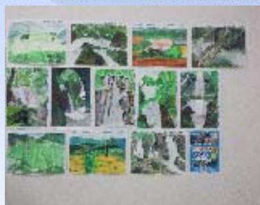
【応募作品展示の様子】

また、平成23年7～8月に、兵庫県と鳥取県の山陰海岸ジオパークエリアの小学校4～6年生を対象としたイベント「山陰海岸ジオパークの絵を描こう！」を鳥取銀行様と連携して実施するなど、「山陰海岸ジオパーク」のPR活動を行っております。