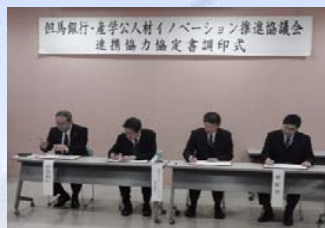
【連携協力協定書調印式の様子】

産学官連携への取組みの一環として、兵庫県立大学経営研究科が主宰する「産学公人材イノベーション推進協議会」に加盟いたしました。