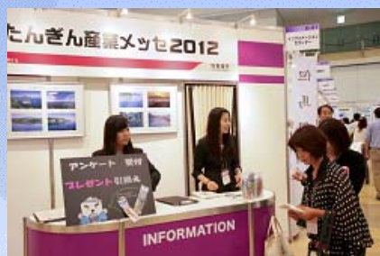
【たんぎん産業メッセ2012の様子】