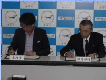
【連携協力協定書調印式の様子】

当行の本店所在地であります豊岡市との間で、「事業連携に関する協定」を締結し、連携して地元経済の活性化に取り組んでおります。