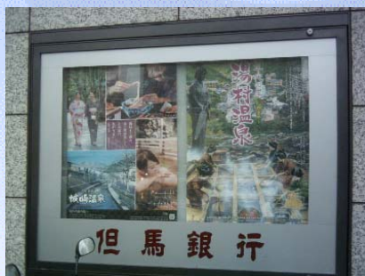
【神戸支店のショーウィンドウの様子】