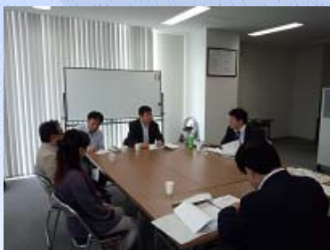
【経営相談会の様子】

専門家による経営相談会実施先数 38 先 各種専門家派遣実施先数 14 先 延74回