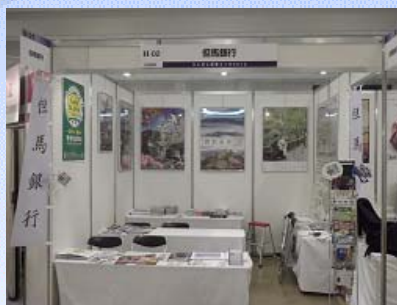
【たんぎん産業メッセ2012】