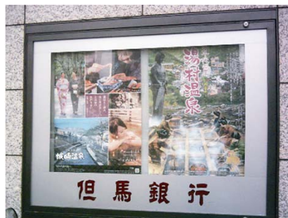
【神戸支店のショーウィンドウの様子】