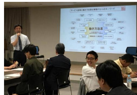
【城崎温泉新しい働き方改革ミーティング】

当行もミーティングに積極的に参加し、参加事業者の経営課題解決に向けた取組みを支援しています。