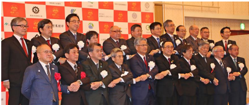
【麒麟のまち観光局設立記念式典】