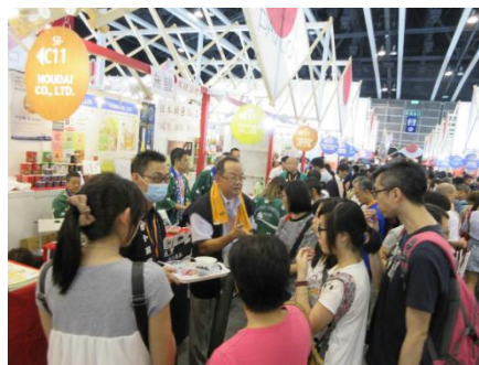
【香港フードEXPOジャパンパビリオンの様子】

兵庫県内の地域食材の海外展開や取引先企業の海外マーケティングを支援するため、香港で開催されるアジア最大の食品展示会「香港フードEXPO2017」への参加企業の推薦ならびにひょうご海外ビジネスセンターと連携した出展支援を実施しました。