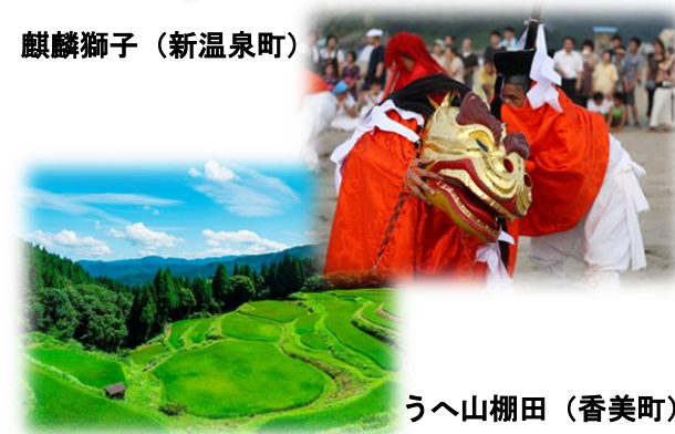
うへ山棚田（香美町）