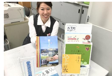
【移住・定住相談窓口】

兵庫県内の自治体（豊岡市、養父市、朝来市、香美町、新温泉町、西脇市）が実施する移住定住に関する各種支援制度の情報提供や移住、U J I ターンに関する相談の取次ぎを行うため、京阪神地域の4支店（姫路支店、神戸支店、大阪支店、京都支店）に、相談受付窓口を設置しました。