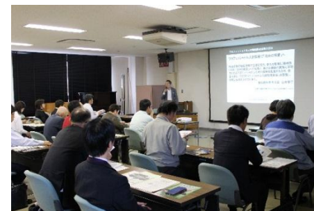
【中小企業支援施策セミナー】

兵庫県や自治体の実施する中小企業向け支援施策の周知や活用促進を図るため、豊岡市、養父市、朝来市、香美町、新温泉町、篠山市、西脇市の7市町において、各地の自治体や商工会等と連携し、「中小企業支援施策セミナー」を開催しました。