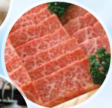
但馬牛セレクト ギフト券