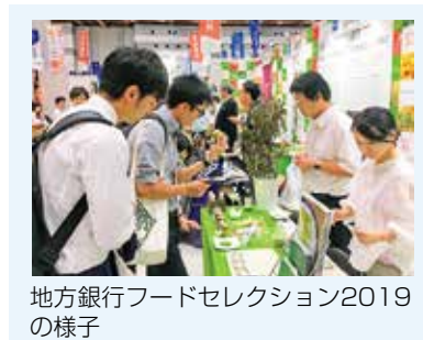
地方銀行フードセレクション2019の様子