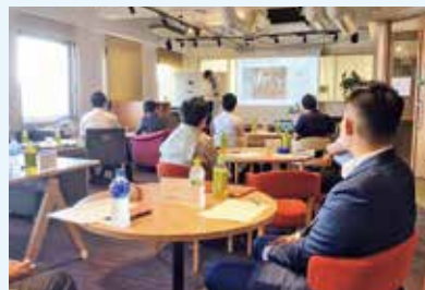
次世代リーダー育成ブートキャンプ講義の様子

経営スキルの向上や経営者としての心構えの醸成等を図るプログラムを提供を通じて、将来地域を牽引する企業経営者の育成に取組んでいます。