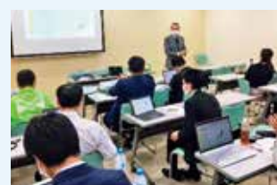
次世代リーダー育成ブートキャンプ講義の様子