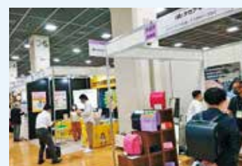
たんぎん産業メッセの様子