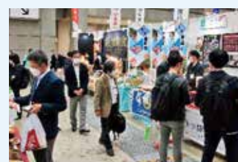
地方銀行フードセレクションの様子