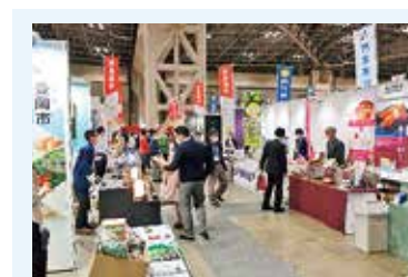
地方銀行フードセレクションの様子