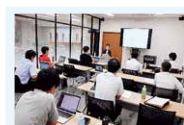
次世代リーダー育成ブートキャンプの様子